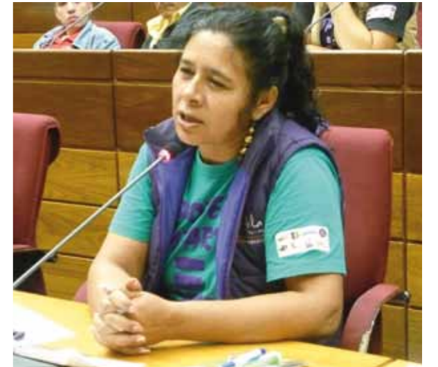
EPIGRAFES Epígrafes epígrafes

Actualmente las organizaciones sociales que componen la mesa de coordinación del Proyecto Demoinfo junto con otras organizaciones civiles ha convocado la conformación un Frente por la Democratización de la Comunicación en Paraguay con el objetivo de realizar un debate amplio y plural para la modificación completa de la ley de Telecomunicaciones, en este sentido se pretende llevar a cabo el próximo 2 y 3 de mayo una gran plenaria con los representantes de las radios comunitarias y las organizaciones sociales que culminara con una marcha ciudadana.