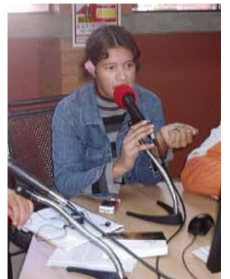
EPIGRAFES Epígrafes epígrafes

(7). Otra ventaja de los medios comunitarios es su utilidad para divulgar y obtener apoyo a las políticas sociales. Programas de alfabetización, de educación vial, de promoción de la salud, de desarrollo comunitario, de