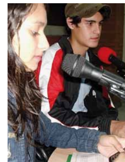
EPIGRAFES Epígrafes epigrafes