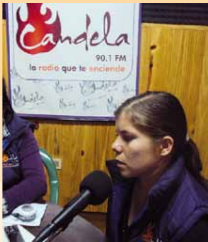
EPIGRAFES Epígrafes epígrafes

cuidado del ambiente, etc., encuentran su mejor aliado en las radios comunitarias. La radio comercial también colabora, pero en general pasa la cuenta. En el Brasil la ley obliga a los medios comerciales a dedicar 5 % de su espacio a la educación. Lo hacen, sí, pero de madrugada o en otros horarios de baja audiencia.