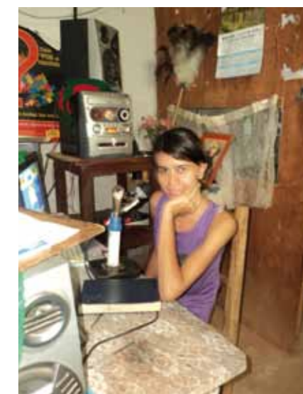
EPIGRAFES Epígrafes epigrafes

Con el cambio de gobierno producido el 20 de abril de 2008, se abrieron más posibilidades de replantear la democratización de las comunicaciones en el Paraguay. Uno de los compromisos asumidos por el actual gobierno fue pagar la deuda histórica que hay con las radios comunitarias en cuanto al reconocimiento legal y a su fortalecimiento como modelo de comunicación que contribuya con el desarrollo del país a partir del desarrollo de comunitario.