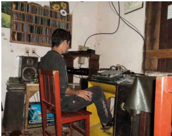
EPIGRAFES Epígrafes epígrafes

El proyecto " Democratización de la información para el ejercicio de los derechos humanos " es un proyecto ejecutado por una mesa de organizaciones sociales conformadas por la Coordinadora de Organizaciones Campesinas (ONAC, MCNOC, CONAMURI, MAP, CNOICP) la Central de Cooperativas de Vivienda por Ayuda Mutua del Paraguay (CCVAMP) la Coordinadora de Empresas Asociativas Rurales Departamentales, la Mesa de Desarrollo de Organizaciones Sociales de Cordillera y VOCES Paraguay, Asociación de Radios Comunitarias y Medios Alternativos.