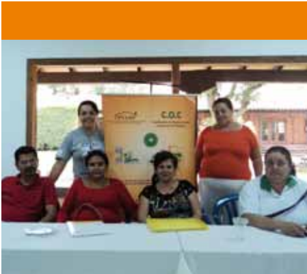
Integrantes de la mesa de coordinación del proyecto Demoinfo durante el taller de planificación anual

Ese crecimiento de 14,5%, que en realidad hay que matizar porque el crecimiento de cada año se mide sobre la cifra del año anterior. La del año anterior fue de -4% es un efecto rebote, como cayó tan bajo cuando