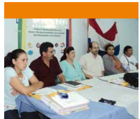
Referentes de organizaciones sociales durante el taller de análisis de coyuntura.

Vemos una comparación de cómo se votó a intendentes en el 2006, que era gobierno de Nicanor Duarte, y en el 2010, que es gobierno de Lugo. El partido colorado perdió 3 puntos, tenía 50 y ahora tiene 47% de los intendentes; el 3% se fue al liberalismo, que ahora es partido de gobierno. PPQ aparece como creciendo, porque el candidato de Asunción era aliancista, entonces en realidad parece que creció pero no es así. Los partidos de izquierda van todos separados, no forman una alianza, e incluso hubo lugares donde el Frente Guazú presentó candidato y los partidos que conforman el Frente Guazú presentaron otros candidatos. Los votos a Concejales, que son votos más fieles, fueron el 13% de la izquierda, pero como fueron todos divididos apenas el 3% se convirtió