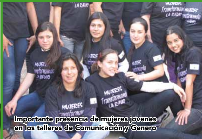
Importante presencia de mujeres jóvenes en los talleres de Comunicación y Género