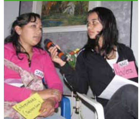
Las participantes realizaron prácticas de programas en vivo

La participación real y efectiva de la mujer en todos los ámbitos de la vida social, económica y política del Paraguay representa uno de los grandes desafíos que requieren de trabajo constante, articulado y decido para lograr superar cifras que actualmente marcan una acentuada brecha de desigualdad entre hombres y mujeres.