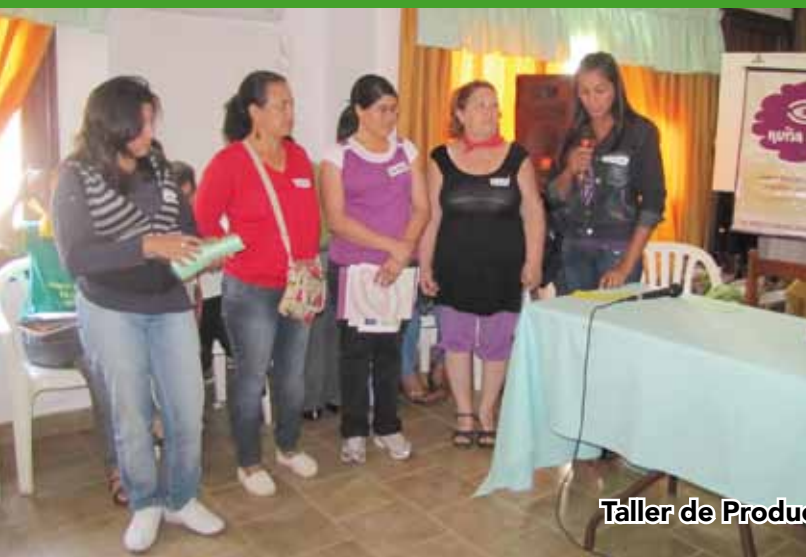
Taller de Producción Periodística