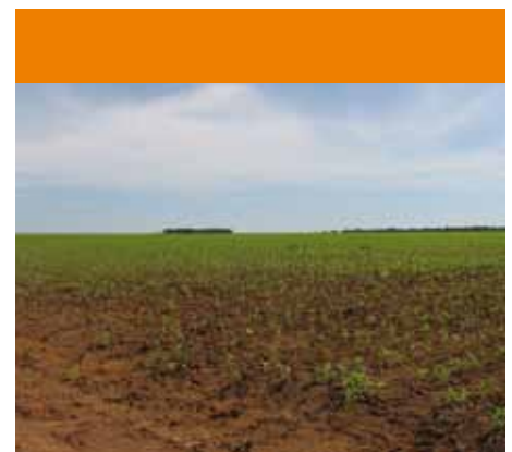
Producción de soja a gran escala

Y hay áreas que ni siquiera se tocó. Cada año el gobierno hace algún ruido para llamar la atención. No hubo ningún proyecto serio de este gobierno para la reforma agraria, por eso se le dio Agricultura a la dere-