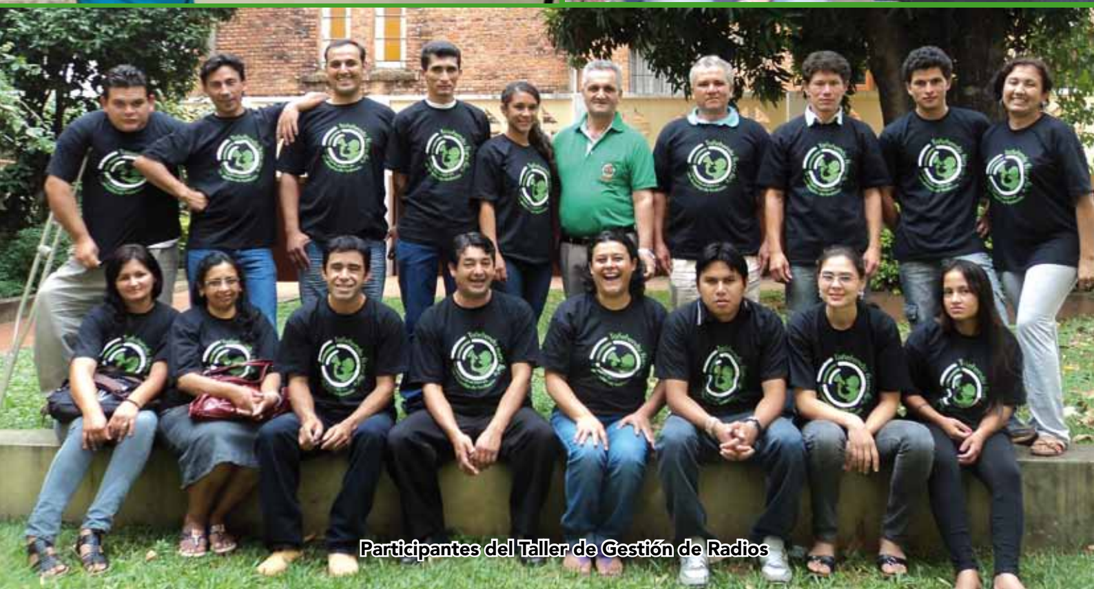
Participantes del Taller de Gestión de Radios