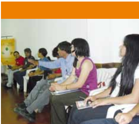
Participantes del taller de coyuntura.

cha y se cambió 4 veces de titular del INDERT. Y para demostrar algún interés al sector campesino hace algún apoyo, como Ñacunday, pero no se hizo nada y ya no se va hacer. Porque ese es el gran poder en el Paraguay, que tienen sus brazos a nivel mediático, y nadie se anima a enfrentarse a esos grupos.