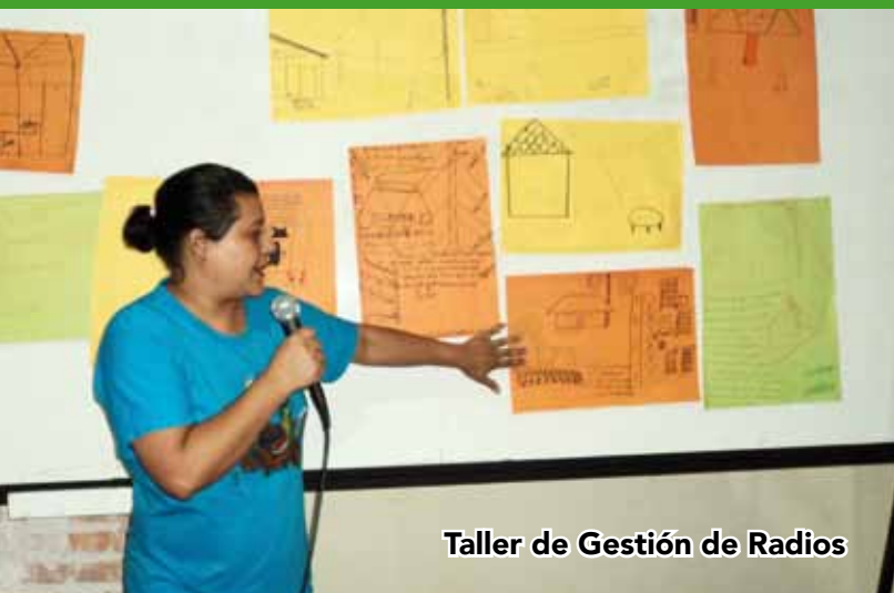
Taller de Gestión de Radios