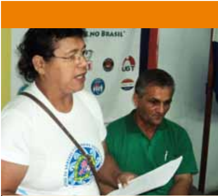
Referentes de la COCIP presentando su análisis de coyuntura.

En la década del '70, que es cuando entra esta economía sojera, Cargill y ADM, en parte son brasiguayos pero en gran parte son trans-