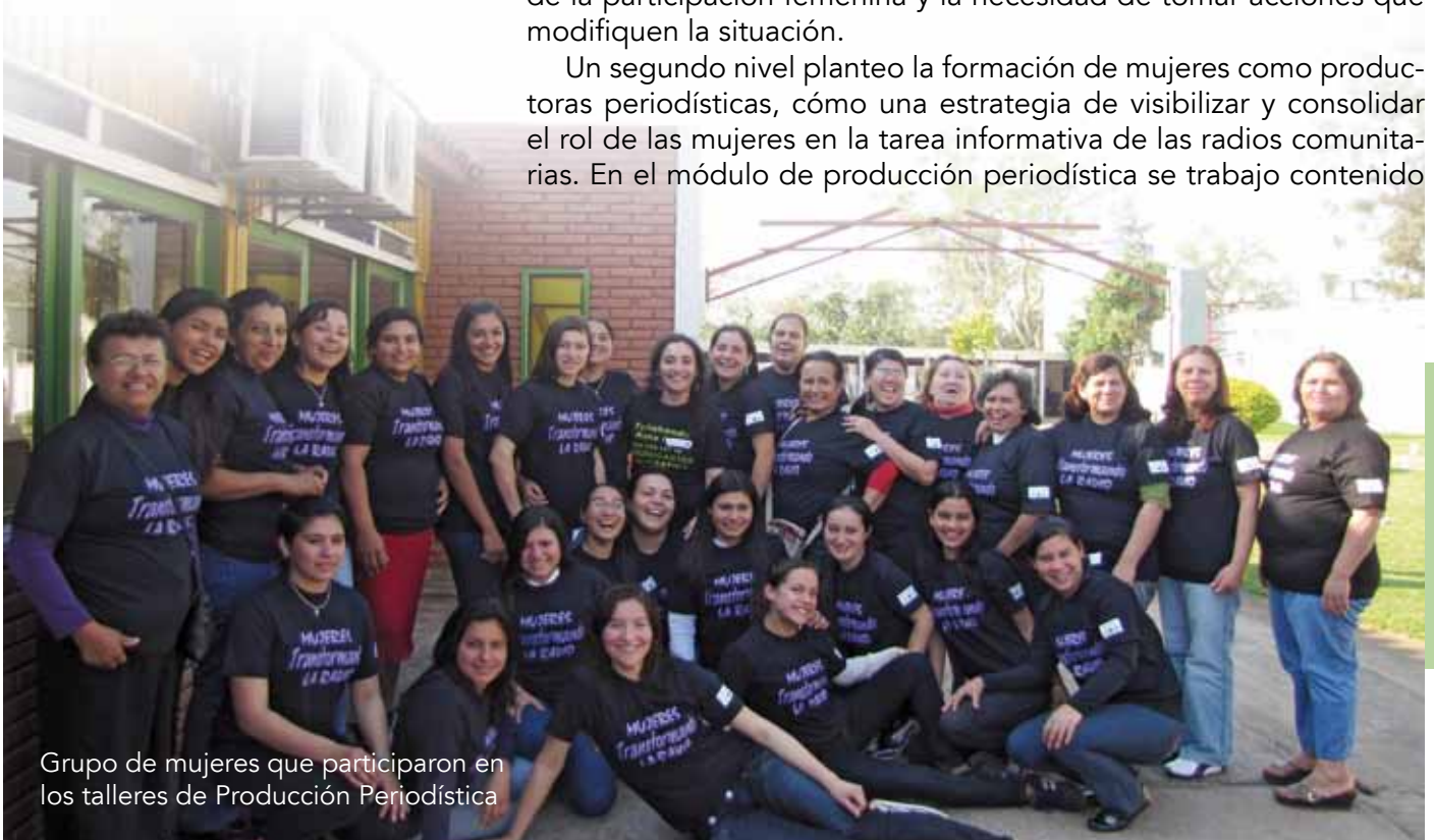
Grupo de mujeres que participaron en los talleres de Producción Periodística

Un segundo nivel planteo la formación de mujeres como productoras periodísticas, cómo una estrategia de visibilizar y consolidar el rol de las mujeres en la tarea informativa de las radios comunitarias. En el módulo de producción periodística se trabajo contenido